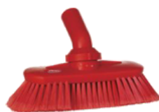
Paredes y exteriores de máquinas