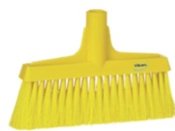
Escoba de cerdas suaves