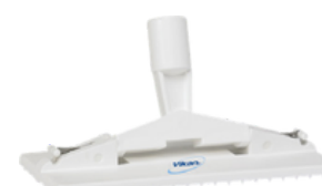
Portafibra de polipropelino