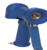
Pistola de agua