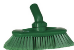
Cepillo de tanques con paso de agua