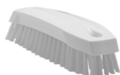
Cepillo pequeño de mano