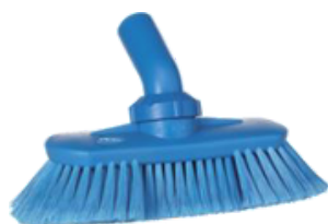
Paredes y exteriores de máquinas