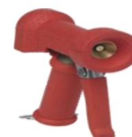
Pistola de agua