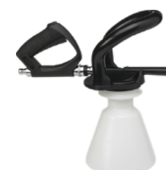
Pulverizador de espuma