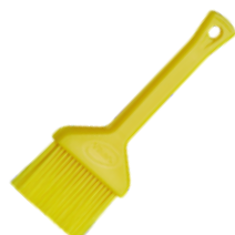
Brochas de repostería