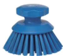
Limpieza de jabas