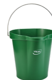
Cubo 12 Litros