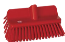
Limpieza de zócalos (unión piso/pared)