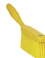
Cepillo de cerdas suaves