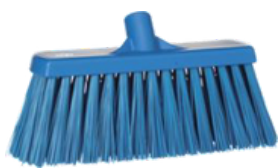
Para un barrido convencional