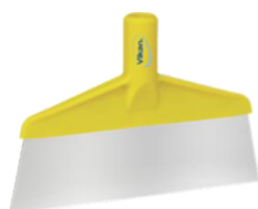
Espátula para piso