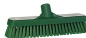
Cepillo de cerdas duras