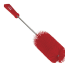
Limpieza de tuberías