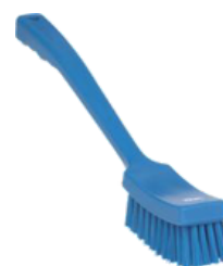
Escobilla mango largo